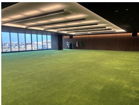
事務所棟3階 大会議室の様子