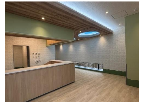
事務所棟1階 託児所の様子

プレスリリースに掲載されている情報は、発表日現在の情報です。その後予告なしに変更されることがございますので予めご了承ください。