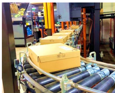
I-Pack®(高速自動梱包出荷ライン)