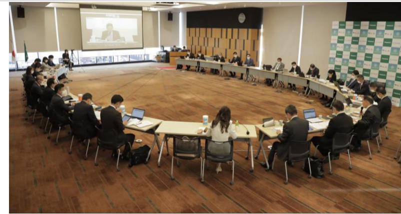
当社経営会議の様子