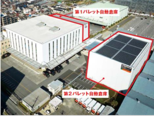
物流センター「プラネット東関東」

第1パレット 自動倉庫棟 1,556パレット 第2パレット 自動倉庫棟 4,556パレット