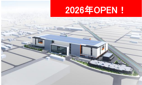
物流センター「プラネット愛知」