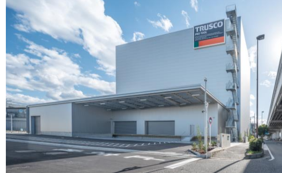
物流センター「堺ストックセンター」