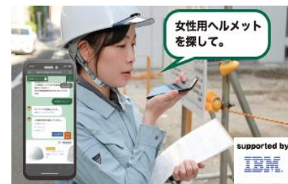
トラスコ AI オレンジレスキュー

「IBM Watson Assistant」「IBM Watson Discovery」を活用し、商品検索サービス「トラスコ AI オレンジレスキュー」の構築を担当。本サービスは、AI の言語解析を利用しており、ユーザーがスマートフォンを利用して仮想アシスタントと対話（チャット・音声）しながら、230 万アイテム以上の商品データベースから欲しい商品を簡単に見つけ出すことを実現しました。