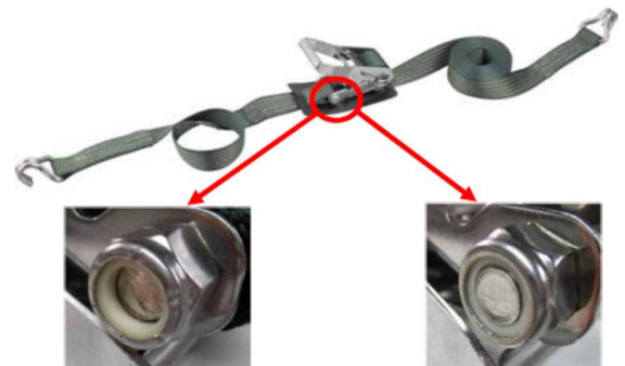
回収対象製品 正常品 ナットの高さまでボルト先端が届いていない ナットの高さまでボルト先端が届いている