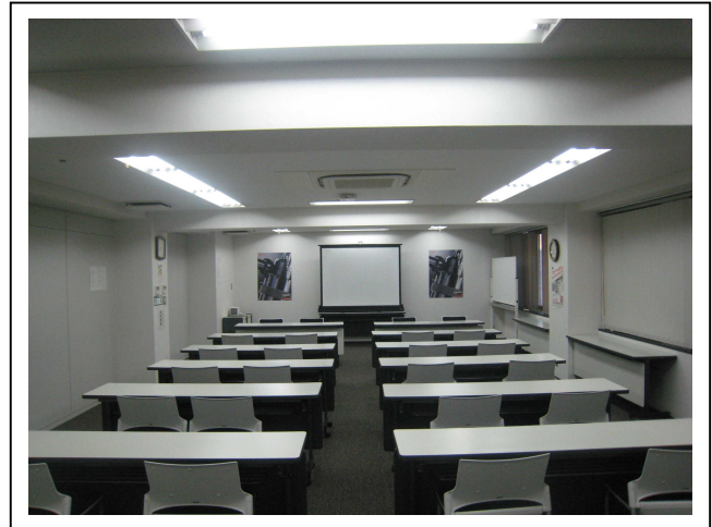
京都支店5階会議室

ニュースリリースに掲載されている情報は、発表日現在の情報です。その後予告なしに変更されることがございますので予めご了承ください。