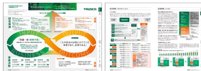
価値創造モデルと経営戦略の全体像を図を用いて表現

当社が人や社会のお役に立つ企業であり続けるために取り組んでいる内容について価値創造モデルをもとに表現。また、事業活動における各戦略について、第60期振り返りと第61期の具体的な取りみについて担当本部長より解説をしています。