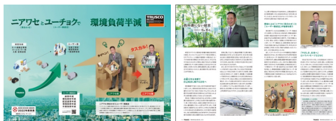
当社の成長戦略とトップメッセージについて写真を多用して掲載

「教科書にない経営」というトップメッセージのもと、当社の成長戦略である「ニアワセ（荷合わせ）」と「ユーザー様直送」についての考えや、具体的な戦略について掲載しています。